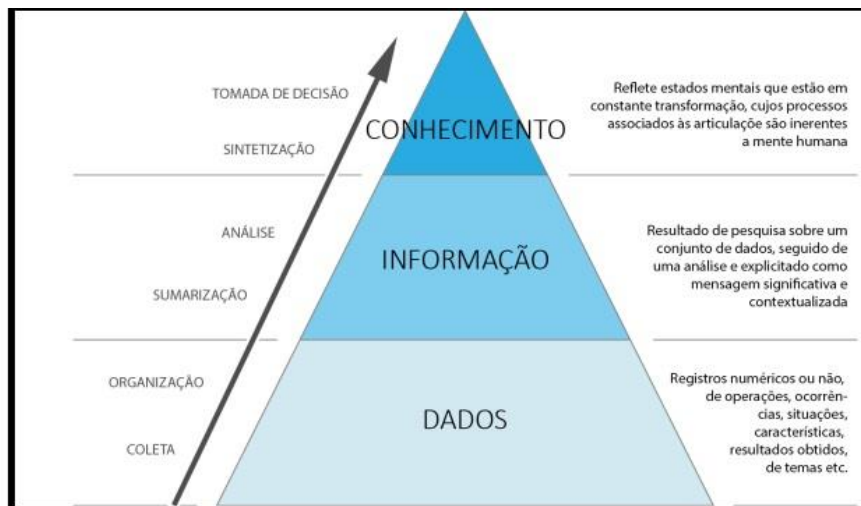
Figura 1 - Pirâmide do Conhecimento

Através disso, é possível demonstrar que a informação é vista como a organização dos dados para que eles consigam transmitir algum significado real. Com informações, então se desenvolve o conhecimento como é esquematizado na Figura 1 a seguir.